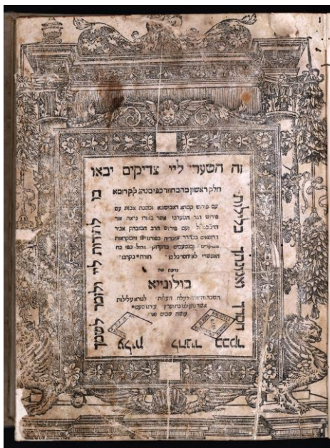
Il Machazor Bene' Romi' (dei figli di Roma, anche detto di Rito Italiano) raccoglie le preghiere di tutto l'anno, è stato uno dei primi ad essere stampato (1485); nel 1540 fu ristampato a Bologna con il commento di Rav Yochanan Treves, con citazioni talmudiche, fondamentale per ricostruire il Minhag (la tradizione liturgica Italiana)