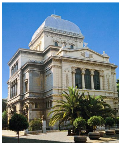
L'edificio della Sinagoga Maggiore di Roma, sede dell'ASCER

L'ASCER conserva, inoltre, un Archivio Fotografico che contiene immagini dall'epoca del ghetto nei periodi immediatamente precedenti la sua distruzione ad oggi, comprese foto della Terra di Israele scattate nei primi decenni del '900; ed un Archivio Musicale che include 740 spartiti.